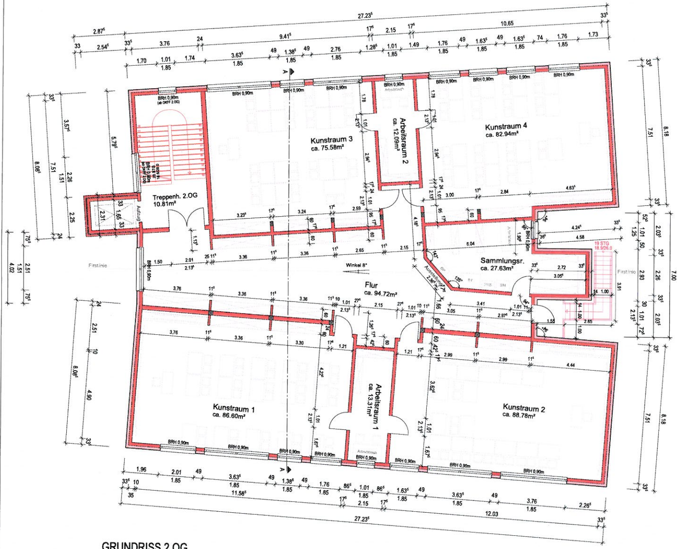
GRUNDRISS 2.OG (Neu)