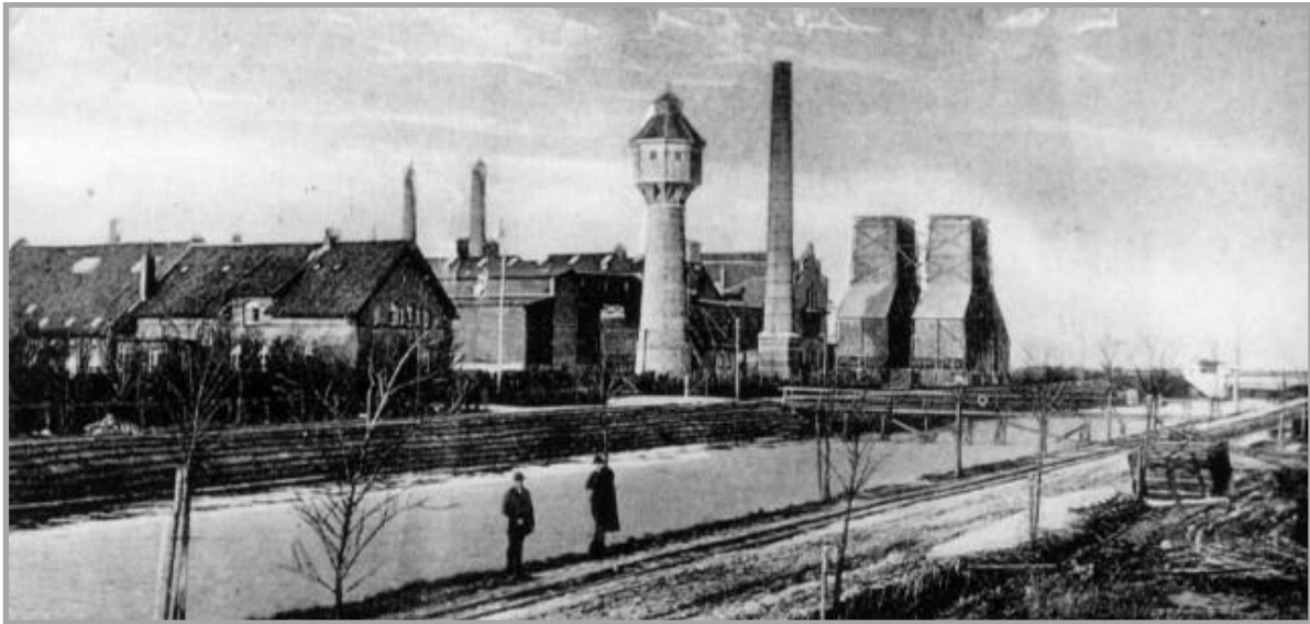
Torfkraftwerk um 1910

1907 entstand das erste Privathaus. Bis zum Ausbruch des Ersten Weltkrieges kamen für 28 Familien und 151 Einwohner 18 Wohnhäuser einschließlich der Werkswohnungen hinzu. Neue Siedler zogen aus den umliegenden Dörfern nach Wiesmoor, darunter auch solche aus den erst nach 1878 angelegten neuen Fehngebieten. Der Bau und Betrieb des Kraftwerks und der dazu nötige Torfabbau versprachen dauerhafte Arbeitsstellen.