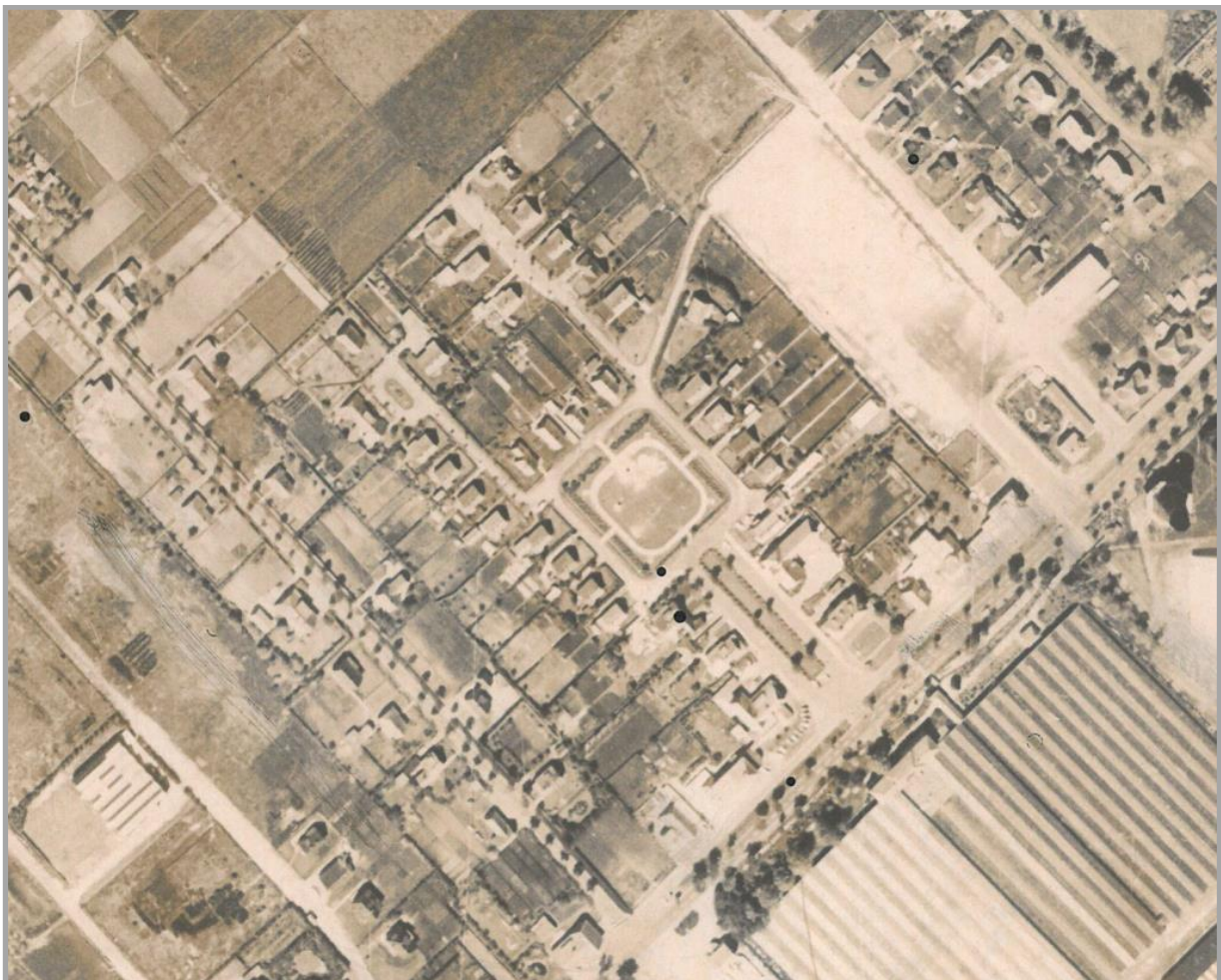
Luftbild 1962 mit ursprünglicher Siedlungsstruktur

Entsprechend dem historischen Vorbild soll auf Zaunanlagen weitgehend verzichtet werden und eine Einfriedung durch standortgerechte Hecken erfolgen.