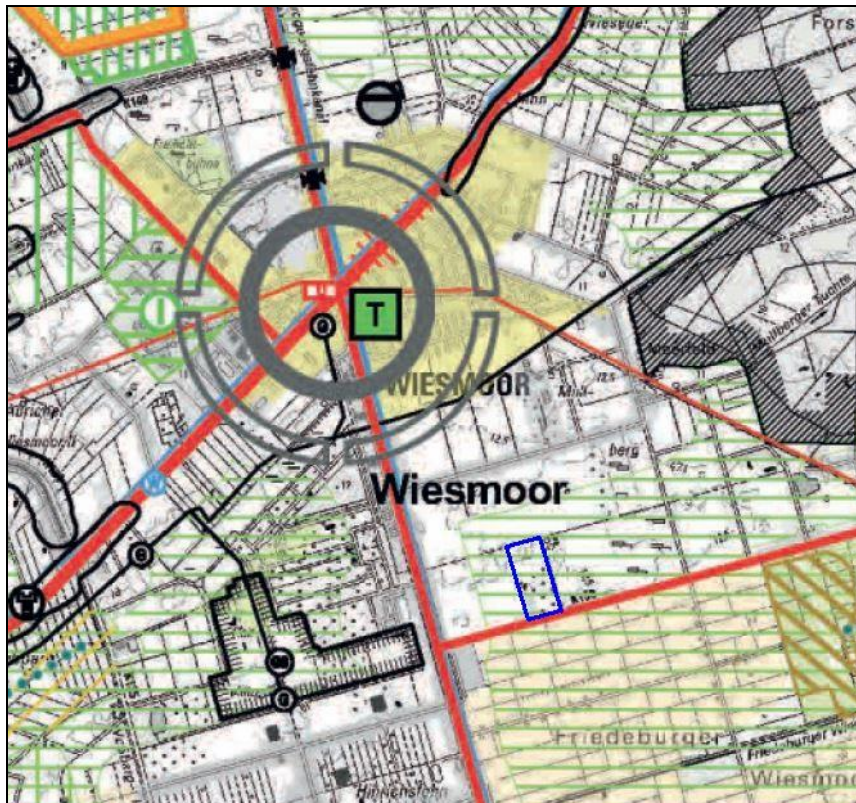
Auszug aus dem Regionalen Raumordnungsprogramm Aurich 2018 - blaue Umrandung nachträglich eingefügt: Geltungsbereich v. Bebauungsplan –

In dem RROP wird die Stadt Wiesmoor als Grundzentrum ausgewiesen. Das Plangebiet liegt in einem Vorbehaltsgebiet für Landschaftsbezogene Erholung.