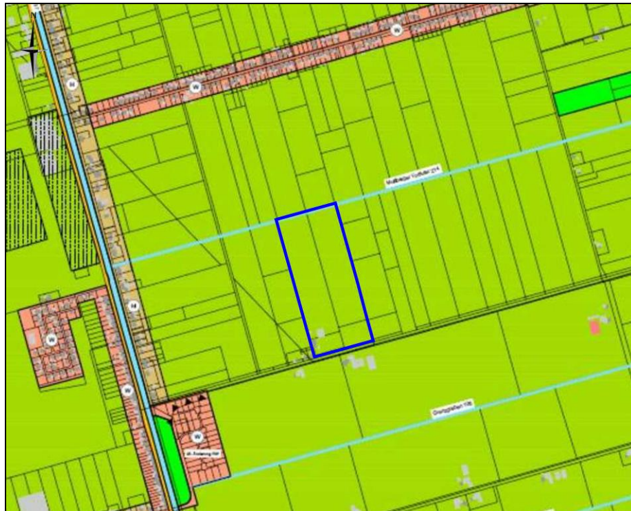
Auszug aus dem gültigen Flächennutzungsplan der Stadt Wiesmoor (ohne Maßstab) - blaue Umrandung nachträglich eingefügt: Geltungsbereich v. Bebauungsplan -

entwickeln. Die Planflächen sind im Flächennutzungsplan als Flächen für die Landwirtschaft dargestellt. Aufgrund der Festsetzungen im Bebauungsplan erfolgt die 60. Flächennutzungsplanänderung im Parallelverfahren gem. § 8 Abs. 3 BauGB.