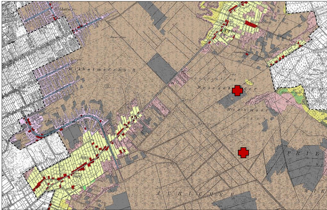
Abb. 1: Ausschnitt historische Karte/Preußische Landesaufnahme von ca. 1890, hellbraune und graue Bereiche, +/- naturnahes Hochmoor; gelb: abgetorfte, kultivierte Fehnflächen, Kreuze: Ungefähre Lage der betroffenen Flächen (Landschaftsplan Stadt Wiesmoor, Entwurf (REGIOPLAN 2008, verändert).